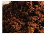
メシマコブエキス