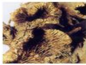
アメリカショウマ根エキス