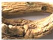
オウゴン根エキス