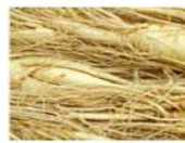
オタネニンジン根エキス