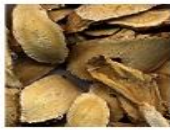
ツルドクダミ根エキス