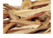
カンゾウ根エキス