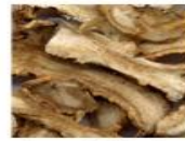
オニノダケ根エキス