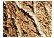
マグワ樹皮エキス